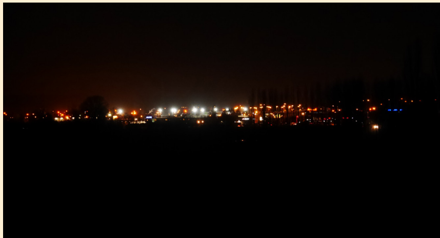
Pollution lumineuse, distance 2 km

Ein Überfluss an nicht notwendigen Leuchten verbraucht unnötig viel Energie, auch wenn die Lichtquellen für sich Energiesparend sind. Die Zunahme an privater Beleuchtung im Außenraum trägt zur Lichtverschmutzung und Himmelsaufhellung bei und sollte daher unbedingt auf ein sinnvolles Niveau eingegrenzt werden.